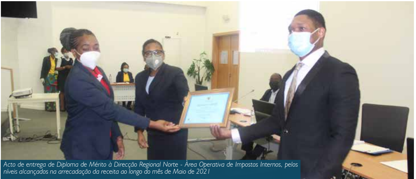
Acto de entrega de Diploma de Mérito à Direcção Regional Norte - Área Operativa de Impostos Internos, pelos níveis alcançados na arrecadação da receita ao longo do mês de Maio de 2021

perspectivas; a avaliação da execução da estratégia de cobrança de receita 2021; a importância do Manual de Procedimentos na busca da melhor eficiência dos processos de trabalho; o impacto da criação de Centros de Digitação; o ponto de situação da implementação da CCR; o resumo do relatório da sexta Cimeira Anual de Impostos; os desafios da economia digital; propostas de alteração pontual da Legislação; Monitoria da dívida tributária e o ponto de situação dos Projectos de Modernização, e –tributação, Máquinas Fiscais e Reestruturação do Cadastro.